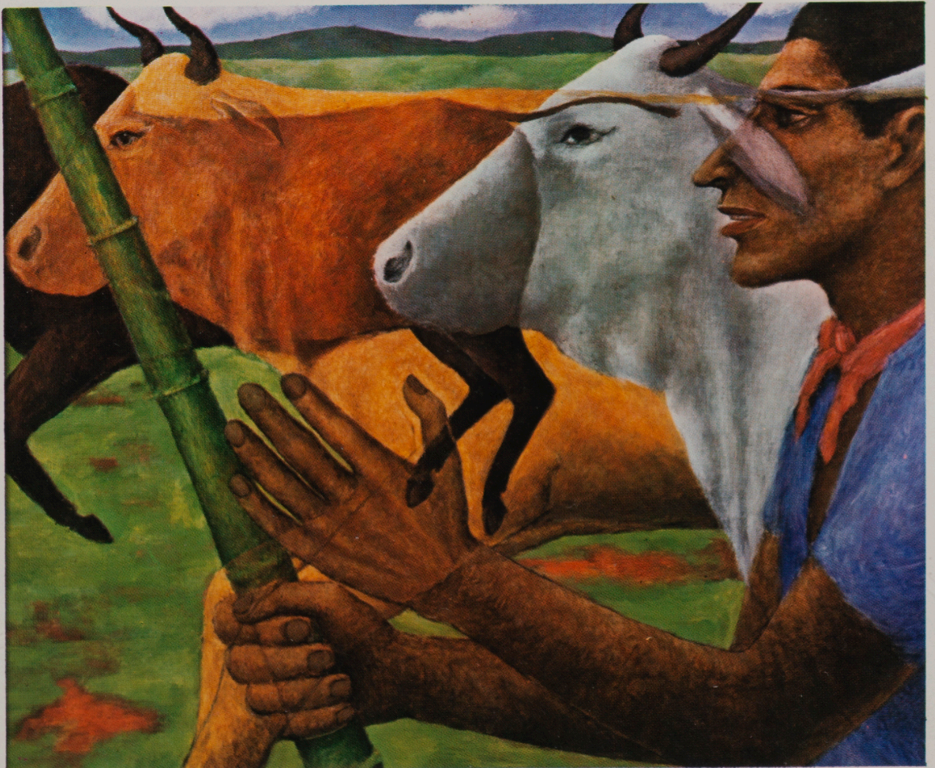
Homem, Gado, Pasto, .Nuvens...