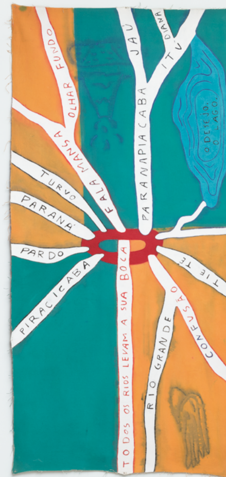
José Leonilson Fortaleza, CE, Brasil Brazil, 1972 – São Paulo, SP, Brasil, 1993