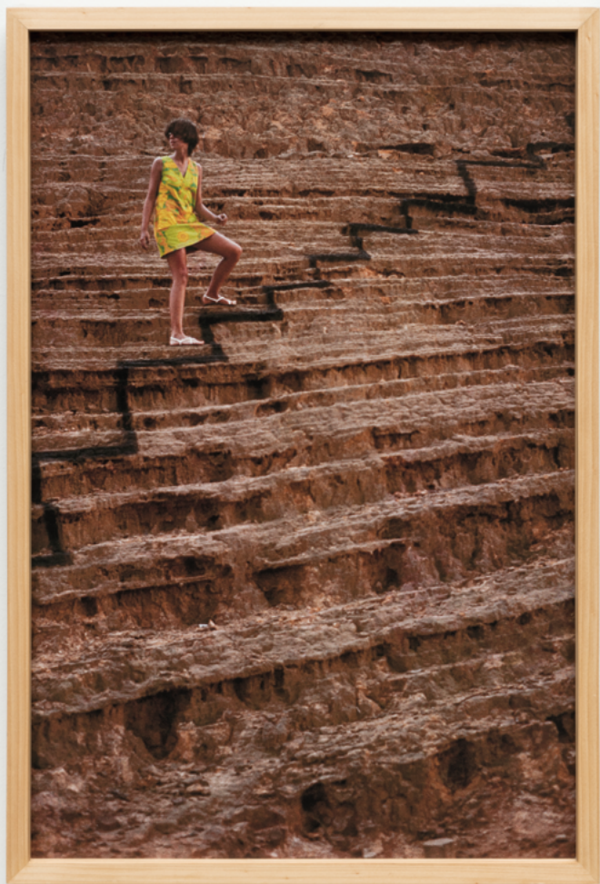
Carmela Gross São Paulo, SP, Brasil Brazil, 1946