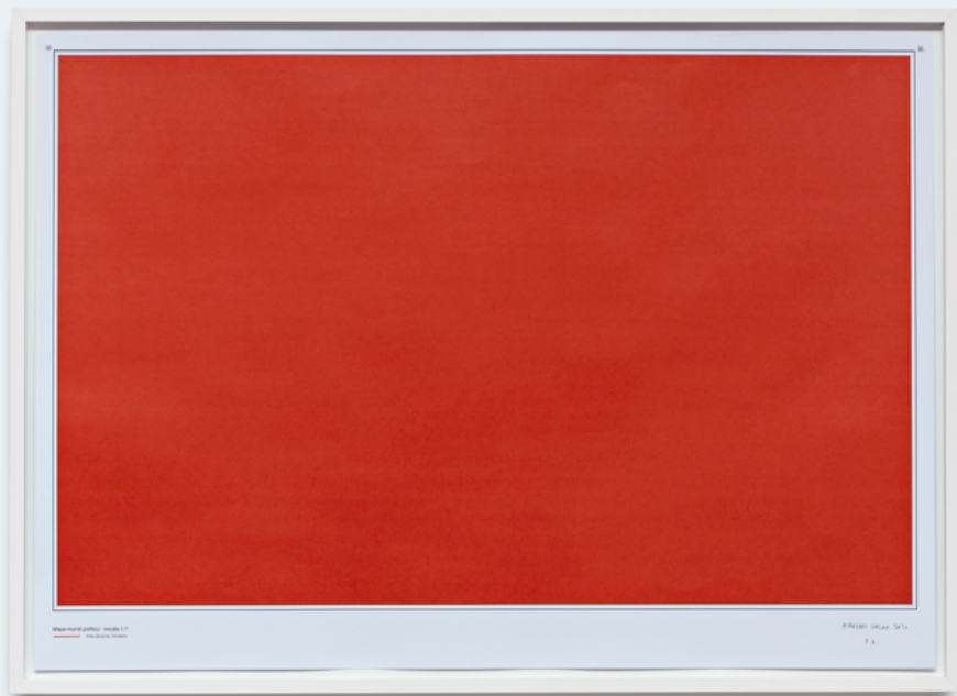
Marcus Galan Indianápolis, Estados Unidos United States, 1972 Mapa-múndi político – escala 1:1 Political World Map 1:1 Scale, 2010 impressão offset sobre papel offset print on paper 79,5 x 108 x 4 cm Doação artista por intermédio do Donated by the artist through the Clube de Colecionadores de Gravura MAM São Paulo, 2010