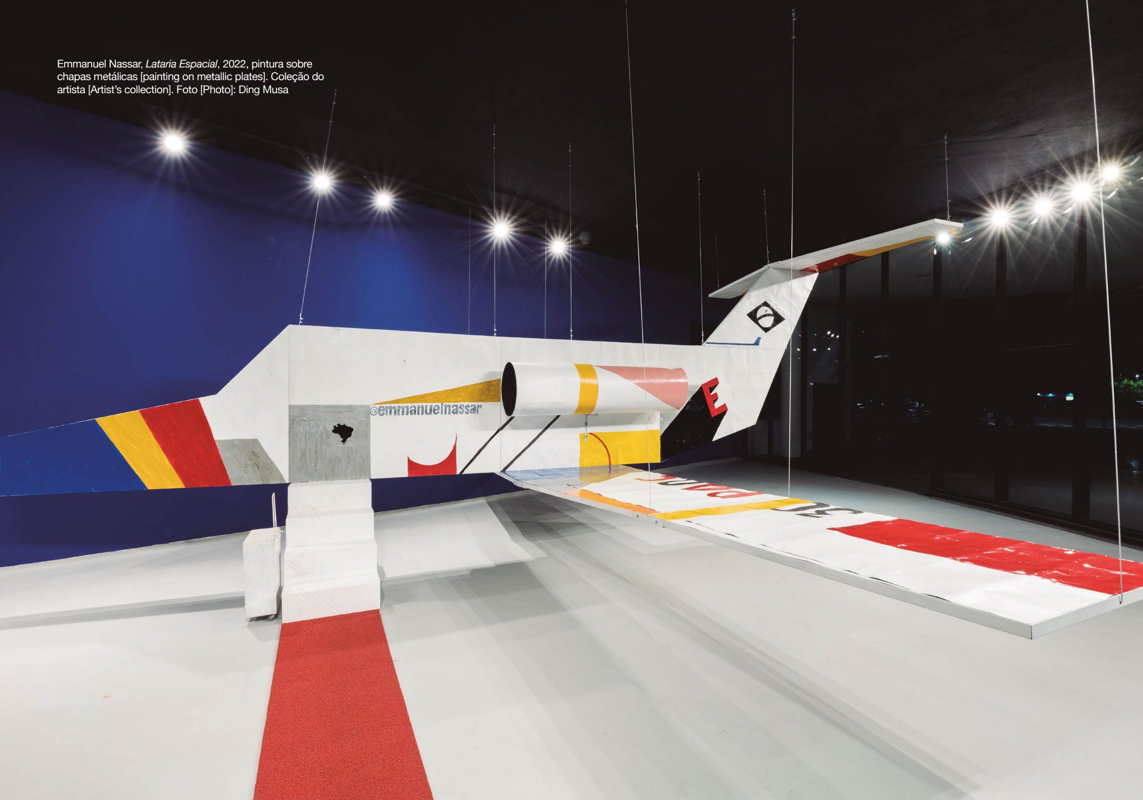
Emmanuel Nassar, Latária Espacial , 2022, pintura sobre chapas metálicas [painting on metallic plates]. Coleção do artista [Artist's collection].